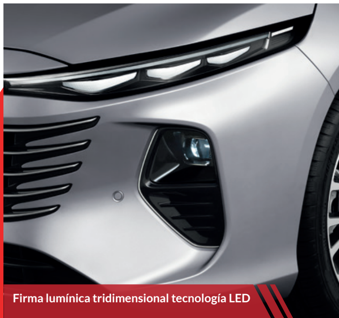
Firma lumínica tridimensional tecnología LED

El diseño ergonómico y los materiales de alta calidad utilizados en los asientos aseguran una experiencia de viaje placentera y confortable para todos los pasajeros.