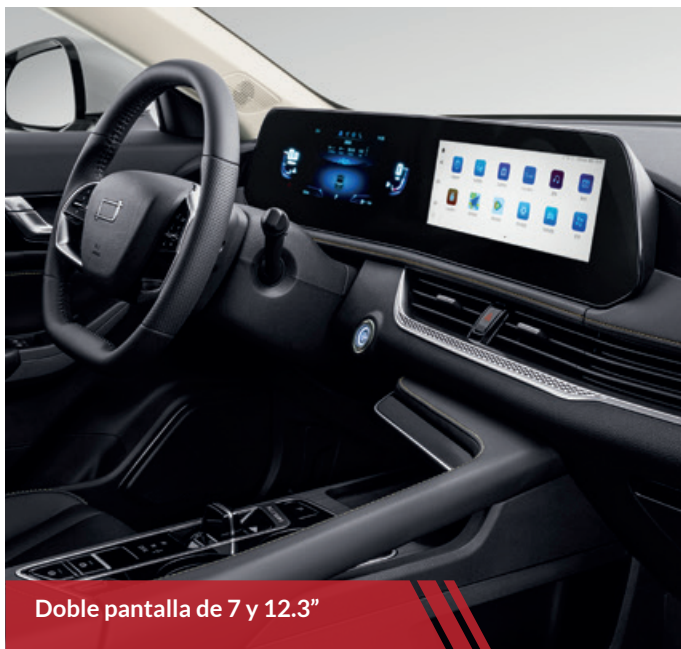
Doble pantalla de 7 y 12.3"