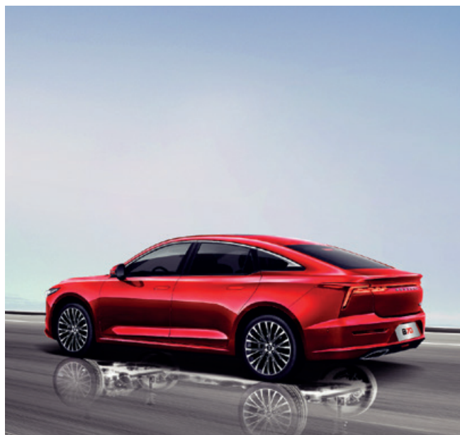
Chasis ligero y resistente