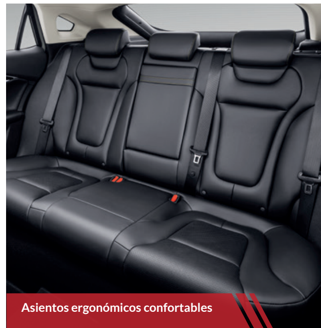
Asientos ergonómicos confortables