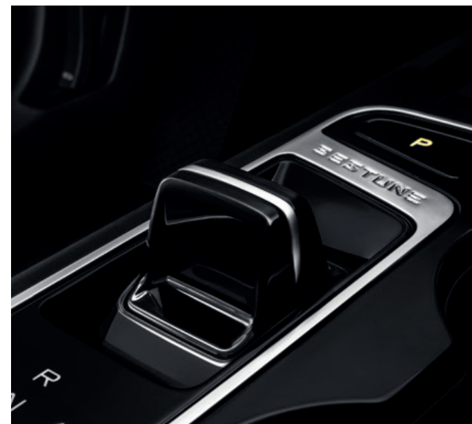
Transmisión automática de doble embrague desarrollada por BorgWarner